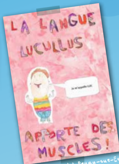
Clis - Ecole Monet à Bruay-sur-Escaut

Toutes les techniques manuelles disponibles peuvent être envisagées pour la réalisation des œuvres (voir les précisions techniques des différentes catégories dans le règlement du concours).