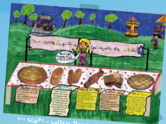
5 ème SEGPA - Collège Flandre à La Madeleine