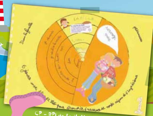
CP - RPI de la Vallée du Faux à Heuchin