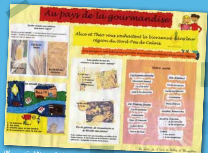
Ulis - Collège Gabriel de la Gorce à Hucqueliers